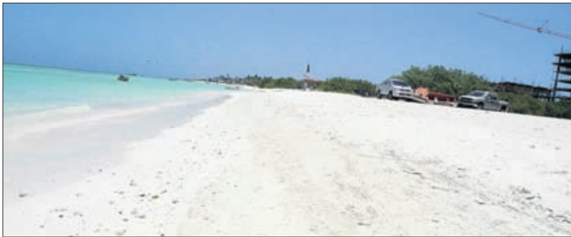
A lanta e acumulacion di foam garna, pero hopi a bay pa lama caba.

Hopi a bay den lama y esaki por tin consecuencia grave pa e bida marino cu por confundi e pida foamnan aki pa cuminda. Ta trata di pida foam cu ta garna na momento cu instala esakinan na banda di muraya, como isolacion. Na momento cu ta corta e foamnan pa laga nan 'fit' miho e biento ta hiba tur esakinan riba beach. Y contrario na exigencia internacional, no a pone un net rond di henter e